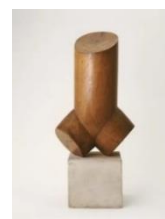
Fig. 4. C. Brâncuși, Torsul unui tânăr , lemn.

Ceara este un material natural, ușor maleabil și este utilizată pentru realizarea sculpturilor, însă treptat a fost înlocuită cu ceara sintetică. Principala utilizare a acestui material în sculptură este pregătirea formei pentru turnarea lucrărilor în metal prin procedeul numit ceară pierdută , etapă preliminară turnării propriu-zise.