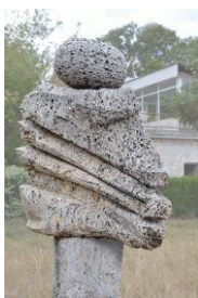
Fig. 5. Liviu Bumbu, Cluj-Napoca, România. Pion , piatră, 173 cm.

Prelucrarea pietrei de calcar este realizată cu ușurință, în funcție de umiditatea blocului de piatră scos din carieră, iar în contact cu aerul pierde din umiditate și capătă un caracter dur, greu de prelucrat. Blocul de piatră de calcar, ca material pentru sculptură, trebuie ales și extras primăvara, prelucrat cât mai rapid, ca sculptura să aibă suficient timp să se usuce, fiind expusă la aer cald. Numai după uscarea completă a pietrei, sculptura poate fi amplasată în aer liber. Sculptura din calcar poros expusă în aer liber este mai dură și mai rezistentă decât cea de marmură. Duritatea calcarului se explică prin existența capilarelor pietrei, porii acestora ocupând a patra parte din volumul pietrei. Rezistența la frig a acestei roci se datorează porilor și prezenței acestora în structura materialului în cantități considerabile.