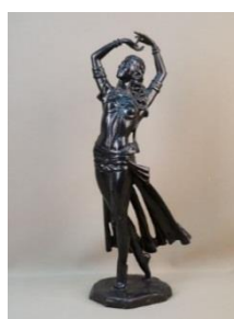
E.M. Falconet, modelator Khoroshenin.