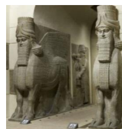
Fig. 6. Muzeul Luvru, Paris, cca 720 î.Hr. Taur înaripat , calcar, 400 cm.