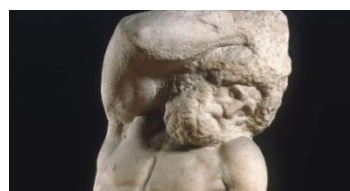
Fig. 9. Michelangelo, Sclav cu barbă, detalu , marmură.

Granitul este o rocă cristalină, foarte dură, alcătuită din cuarț, feldspat și mică, cu aspect găunțos și strălucitor. Datorită durității și rezistenței la erodare și intemperii, granitul este folosit în construcții și în artă. Sculptura din granit este foarte compactă, cu forme generale și cu absență a detaliilor mici. Proprietatea granitului, ca material pentru sculptură care dictează crearea formelor ample, fără detalii, îl califică pe acesta ca fiind unul din cele mai bune materiale pentru arta monumentală.