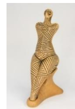
Fig. 2. Statuie feminină, Cultura Cucuteni, lut.

Ghipsul este folosit de către egipteni încă din antichitate. Formele de ghips slujesc pentru multiplicarea în lut, pentru teracotă, faianță, porțelan. Se mai folosesc formele de ghips pentru confecționarea sculpturii în beton, turnarea modelelor din ceară și în metal. Produsul din ghipsul cu durabilitate mare se deosebește prin rezistența la frig și umezeală, ceea ce ne amintește de sculptura în porțelan sau marmură [6].