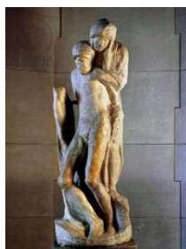
Fig. 8. Michelangelo, Pieta Randonini , marmură.