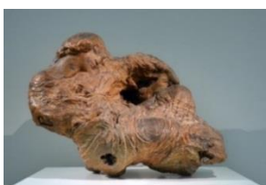
Fig. 3. S.D. Erizia, Zburătorul , lemn.

Fiecare lemn de copac de o esență anume se comportă diferit, în funcție de proprietățile fibrelor sale. La începutul secolului XX în sculptura din lemn existau două direcții: 1) „să te supui” materialului, 2) „să supui” materialul ideii tale. Stepan Dm. Erizia, ca plastician, se lăsa condus de direcția potrivit căreia materialul este supus gândirii artistice – Zburătorul , iar cealaltă direcție este realizată prin opera lui Constantin Brâncuși – Torsul unui tânăr .