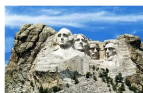
Fig. 10. Sculptură egipteană, Foto: gallery.8r4d.com. Fig. 11. Gutzon Borglum Muntele Rushmore din Dakota.

În sculptură, pe lângă piatră, marmură, granit, calcar, lemn ș.a., bronzul a fost folosit ca material alternativ, având calități durabile în timp. Acesta a început să devină material principal în realizarea lucrărilor statuare finale. Bronzul s-a folosit în realizarea operelor de tip basorelief, altorelief, mezzo-relief sau ronde-bosse (tehnici ale sculpturii) [8]. Bronzul este un aliaj realizat din 80-90% cupru și 10-20%