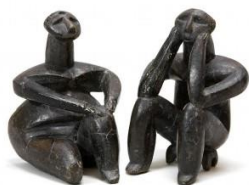
Fig.1. Gânditorul de la Hamangia, lut.

Luturile care se folosesc pentru lucrările de sculptură sunt de culoare galben-verzuie, sur-verzuie, sură, albastră, galbenă, sur-gălbuie, sur-albuie, argintie. Cel mai des utilizat este lutul verzui care scade mai puțin la pierderea umidității. De cele mai dese ori sculptorii au ales teracota, în culoarea ei naturală, apropiată de cea a pielii omenești, pentru a modela portrete de femei și copii [5], (de exemplu: Gânditorul de la Hamangia, Statuie feminină, Cultura Cucuteni).