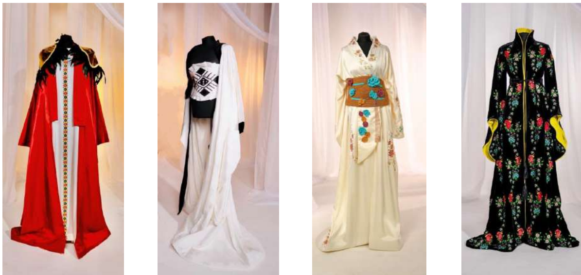
Figura 9. Designer Ermurachi Carolina. Capsulă compusă din patru piese vestimentare - față.

Elemente etnice românești în kimonoul japonez. Imagini din albumul de colecție.