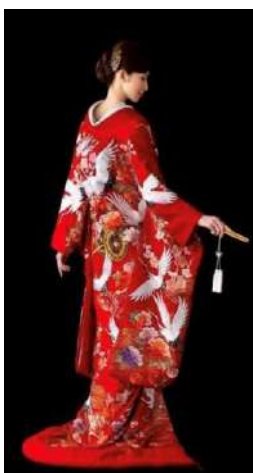
Figura 8. Kimono cu sacură și cocori.