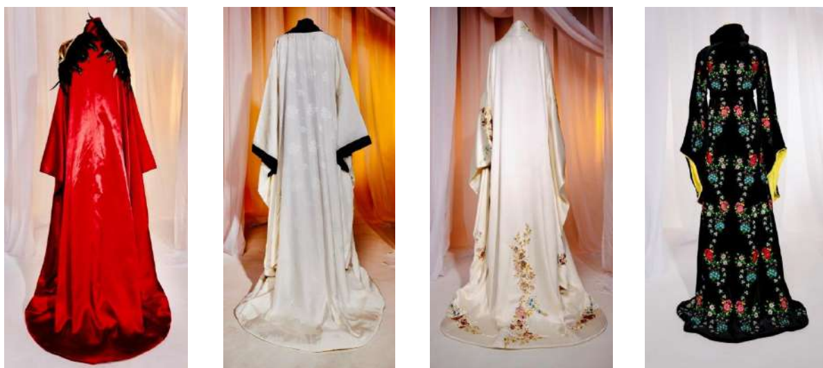
Figura 10. Designer Ermurachi Carolina. Capsulă compusă din patru piese vestimentare - spate.

Elemente etnice românești în kimonoul japonez. Imagini din albumul de colecție.