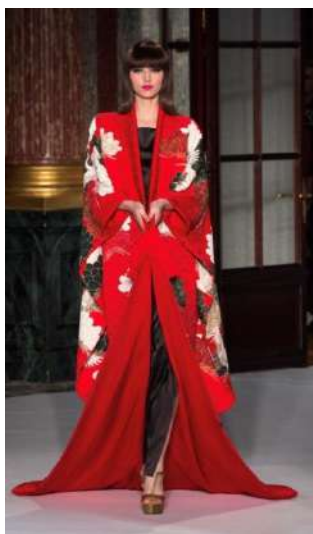
Figura 5. Yumi Katsura, Haute - Couture 2017, Colecția Primavara - Vara.