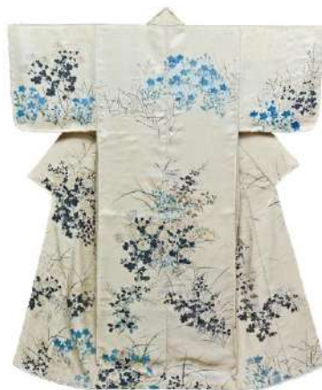
Figura 1. Kimono (Kosode) cu flori și plante de toamnă. Perioada Edo, secolul al XVIII-lea. Muzeul Național din Tokyo.