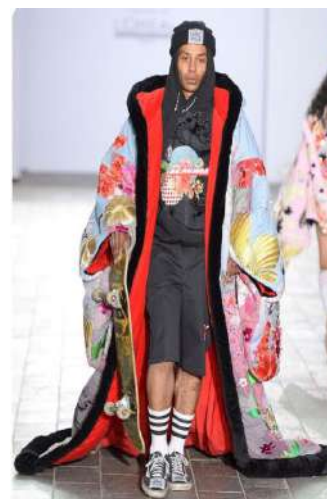
Figura 7. Central Saint Martins, Prêt - à - Porter 2015, Colecția Toamna - Iarna.