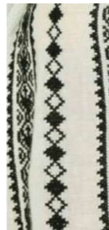
Figura 13. Broderie inspirată de Coloana de C. Brâncuși