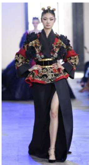
Figura 6. Elie Saab, Haute - Couture 2019, Colecția Toamna - Iarna.