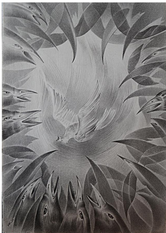
Рисунок 2. М. Корсак, Древо нерожденных возможностей . 2022 г. 21x30 см, бумага, карандаш, линер.

Рисунок 1. М. Корсак, Общественное мнение может убивать . 2023 г. 30x21 см, бумага, карандаш, линер.