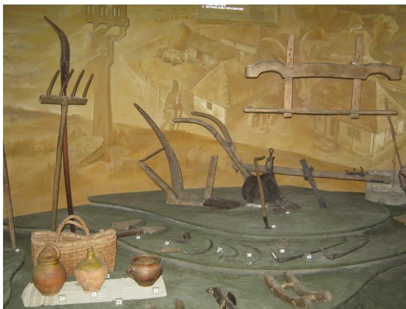
Fig. 14. Pluguri de lemn, cu brăzdare de fier, unelte de muncă, ulcioare, coș de papură. Expoziția permanentă a Muzeului Național de Etnografie și Istorie Naturală.