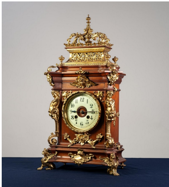
Fig. 22. Ceas pentru șemineu „Gustav Becker”.