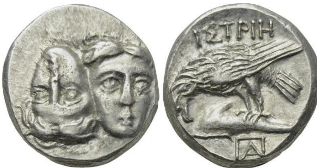
Fig. 3. Drahmă de Histria (avers și revers)