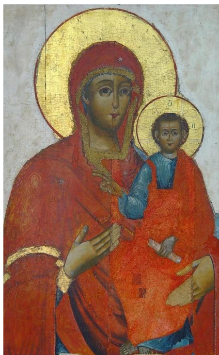
Fig. 12. Maica Domnului Hodighitria (sec. XVI).

(după Muzeul Național de Artă al Moldovei. Chișinău: S.n., 2016, p. 64)