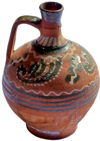
Fig. 15. Burlui.