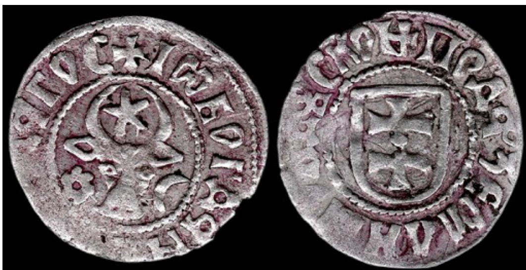
Fig. 4. Grosz din Moldova medievală (avers și revers)