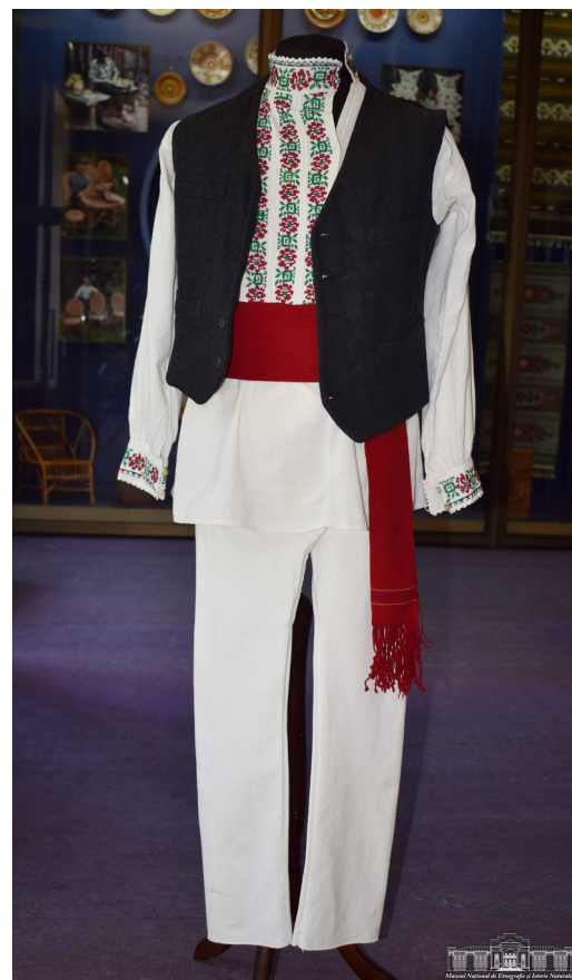
Fig. 18. Costum tradițional pentru bărbați.