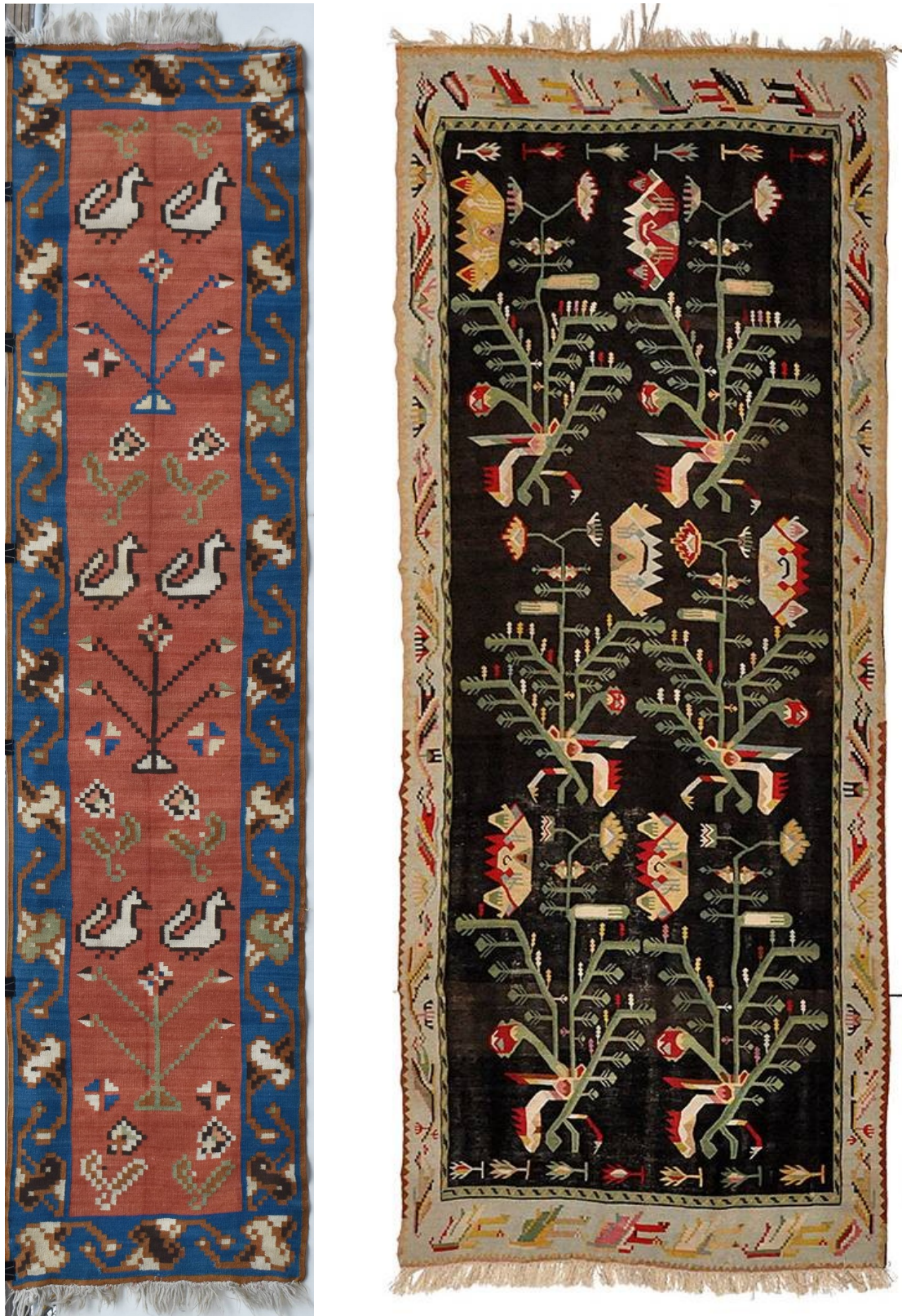
Fig. 19-20. Scoarțe tradiționale basarabene.