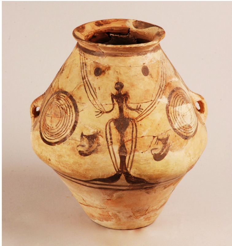
Fig. 1. Vas-amforă (3900-3800 î.Hr.), Cultura Cucuteni-Tripolie, s. Sofia, r. Drochia.