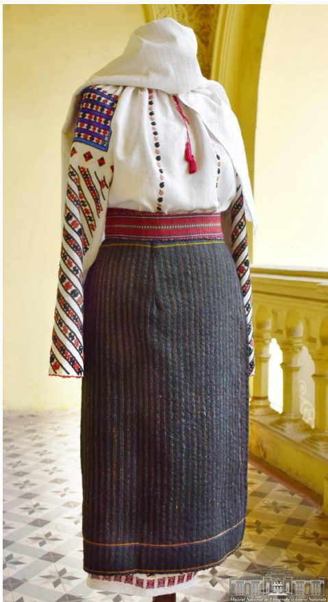
Fig. 17. Costum tradițional pentru femei.