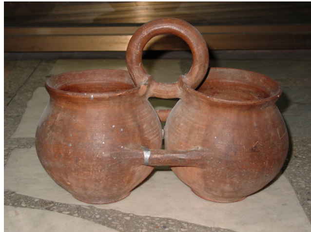
Fig. 16. Vas-tortar.