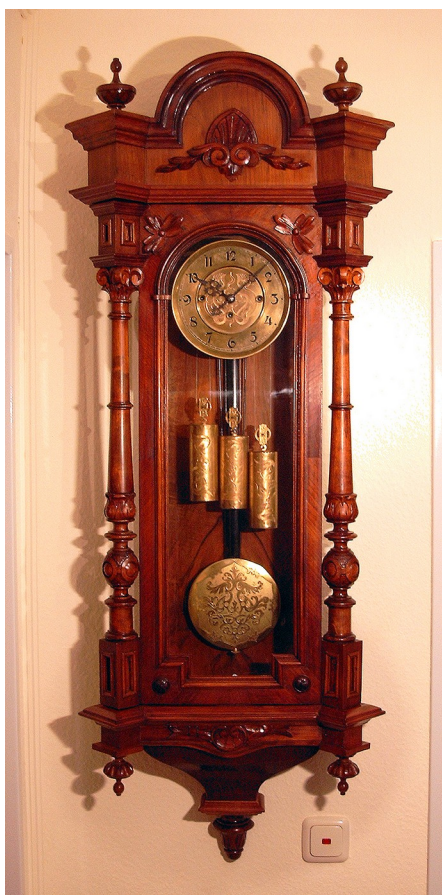
Fig. 21. Orologiu „Gustav Becker”.