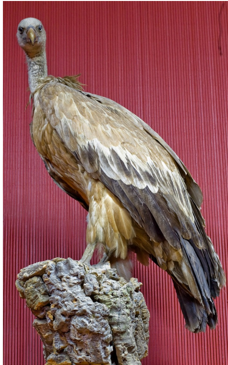
Fig. 26. Vultur pleşuv sur .

Deţinător și foto: Muzeul Național de Etnografie și Istorie Naturală.