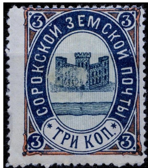
Fig. 8. Timbru emis de Zemstva din Soroca.