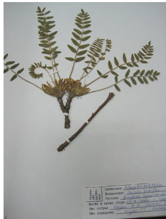
Fig. 24. Scoruş de munte.