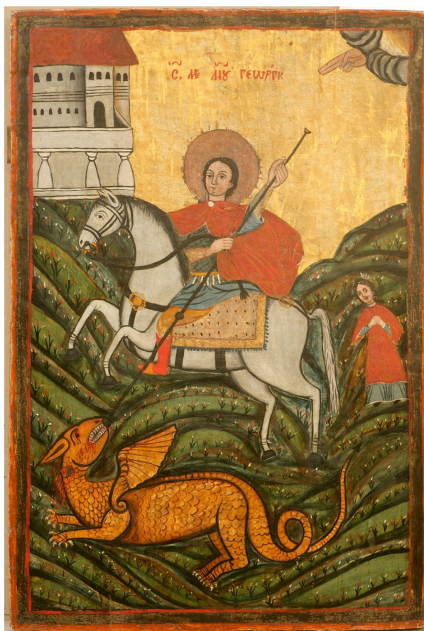
Fig. 13. Zugravul M. Leontovici, Sfântul Gheorghe ucigând balaurul (1806). Din colecțiile Muzeului Național de Artă al Moldovei.