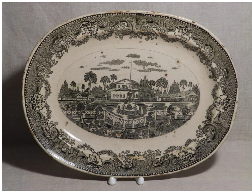
Fig. 23. Farfurie a fabricii Kuznetov.