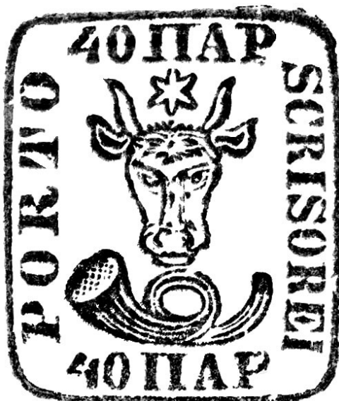
Fig. 7. Timbrul „cap de bour”.