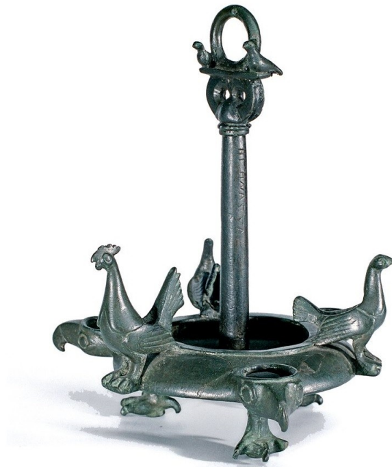
Fig. 2. Opaț grecesc, sec. IV î.Hr., s. Olănești, r. Ștefan Vodă.