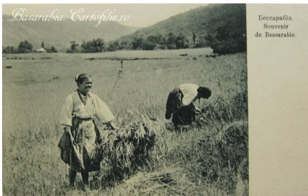
Fig. 9. Carte poștală basarabeană, editată de Al.-W. Wolkenberg.