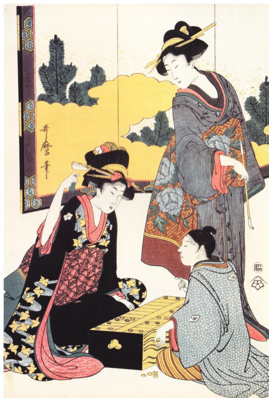
Fig. 11. Kitagawa Utamaro (1753-1806), Sugoroku .

(după Muzeul Național de Artă al Moldovei. Chișinău: S.n., 2016, p. 64)