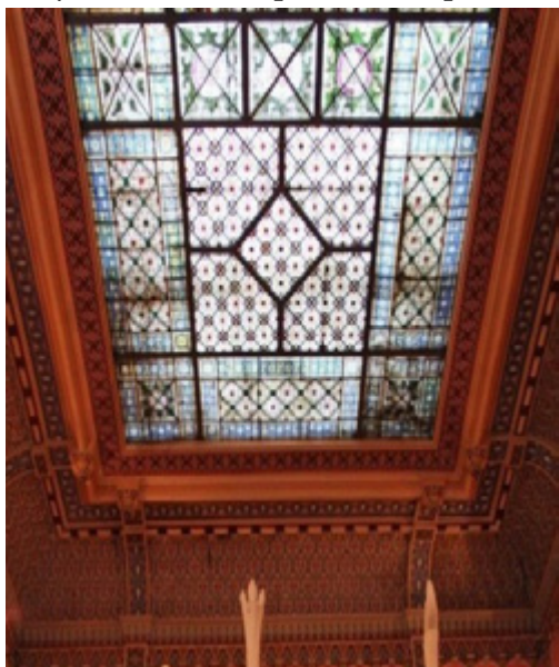
Рисунок 3. Геометрический орнамент

Витражная композиция составлена в восточном арабском стиле. Этот стиль характеризуется запретом на изображение человека и состоит из двух видов орнамента геометрического и флористического. Геометрический орнамент представляет собой сетчатую структуру геометрического узора (Рисунок3). Узорам присущ точный и четкий ритм.