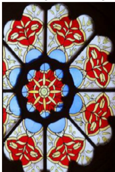
Рисунок 4. Флористический орнамент