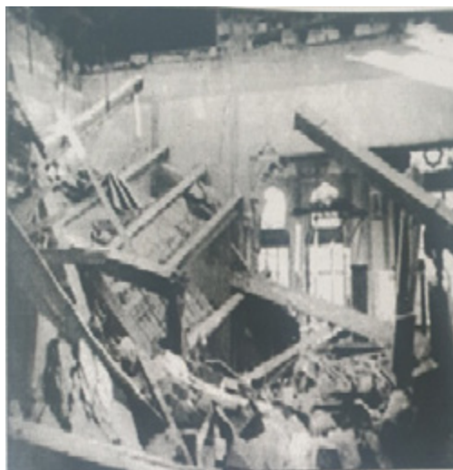
Рисунок 6. Последствия землетрясения 1940 г.