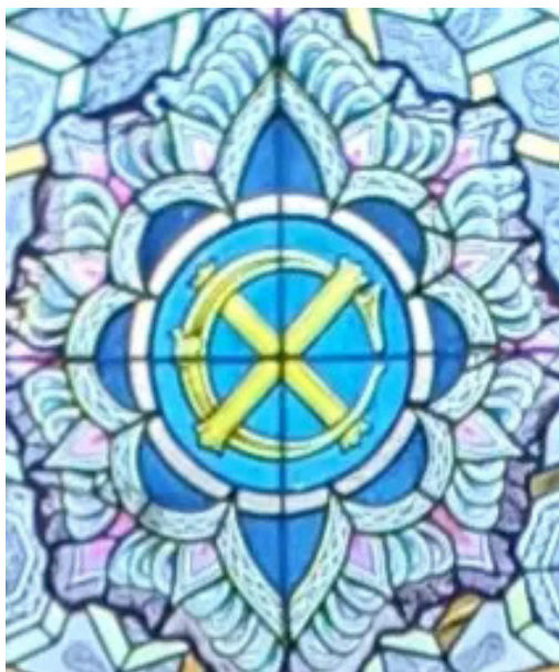
Рисунок 5. Символ Уроборос